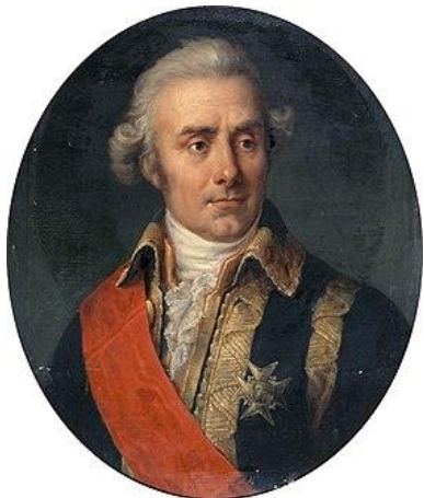
Louis-Charles, comte Du Chaffault de Besné

« En 1756, la guerre de Sept Ans éclate entre la France et l'Angleterre. Le 11 mars 1756 au matin, après quarante-trois jours de traversée, alors que Du Chaffault commande L'Atalante dans la division du comte d'Aubigny. Cette division est alors composée de trois bâtiments : le Prudent , de 74 canons , commandé par le comte d'Aubigny, L'Atalante , de 34 canons, commandée par Du Chaffault, et le Zéphyre commandé par Latouche-Tréville . Sur les atterrages de la Martinique, du Chaffault signale au chef de Division la présence d'un trois mats d'aspect militaire. D'Aubigny lui donne l'ordre de le chasser. L'Atalante poursuit alors le Warwick , vaisseau anglais de 60 canons commandé par Molyneux Shuldham. Le Prudent et le Zéphyre suivent de loin et n'interviendront pas.